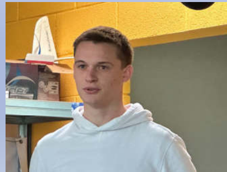
Assemblée Générale – 24 novembre 2024